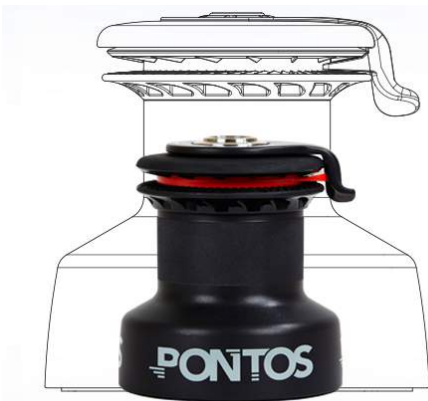
TAILLE 28, PUISSANCE D'UN 45

Le winch Compact a 2 vitesses. La première, deux fois plus rapide qu'un winch standard et la seconde beaucoup plus puissante qu'un winch de la même taille. C'est son mécanisme épicycloïdal, utilisé pour la première fois dans un petit winch qui permet ces performances hors du commun. Démarrez en première en embrayant 25cm par tour de